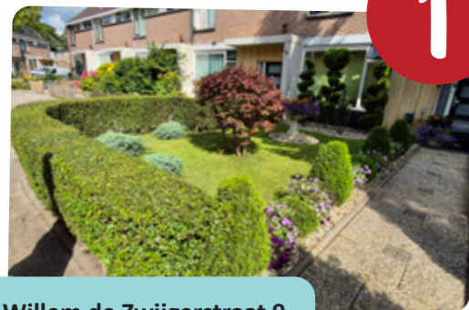
Willem de Zwijgerstraat 9