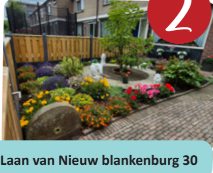
Laan van Nieuw blankenburg 30